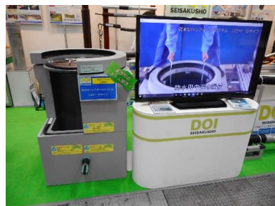
製品コンクール出展品 「防水型ハンドホールシステム DDH-Sタイプ」