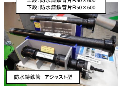
上段:防水鑄鉄管片R50×600 下段:防水鑄鉄管片R50×600 防水鑄鉄管 アジャスト型 公共建築設備工事標準図 記載 「防水鑄鉄管片R50×600 他」