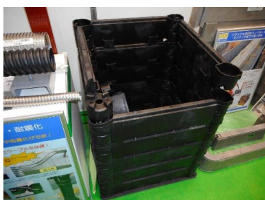
軽量組立式リサイクル樹脂製 ハンドホール「DD-MK」