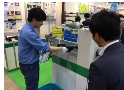
「ストバック 2100 アクアストップ」 止水実演