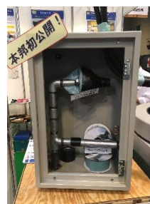
防食材料 「スタックラッピングバンド」