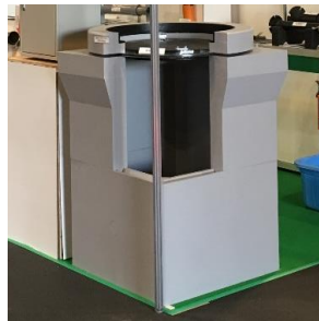
防水型ハンドホールシステム 「DDH-Style」