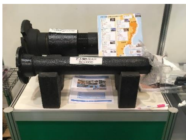
防水铸铁管片R 50 防水铸铁管アジャスト型 50