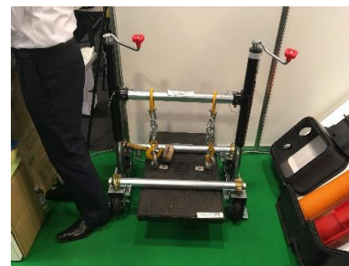
マルチ蓋開閉工具 「フルオープナースマート」