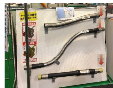
「EPスライダー、短管付EP管、 緩衝防護管」