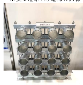
橋梁添架用管路多段システム