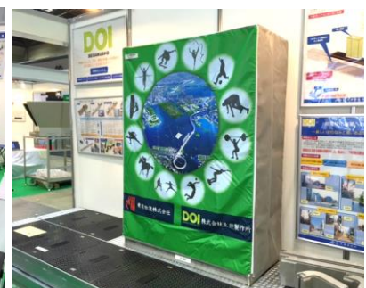
地上機器落書き防止カバー