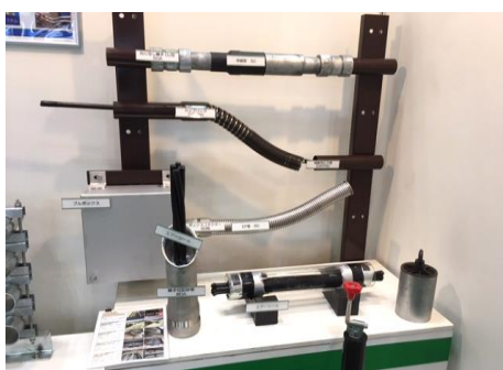
橋梁添架管路材(耐震・メンテ) 傾斜付防砂管(低圧引込) 挿入型防水装置「エアースील」