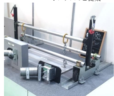
蓋版開閉工具「フルオープンスマート」