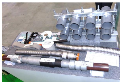
橋梁添架管路材(耐震・メンテ) 橋梁添架用管路多段システム