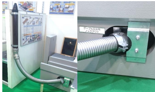
小型ボックスと低圧引込(EP管+DDコネクター)