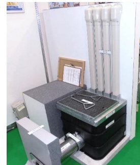
電力・通信共用引込みシステムのご提案