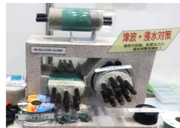
開口部浸水対策工法