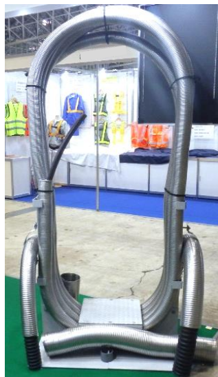
EPスリーブ防護管・EP管